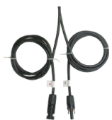
1,5m. de cable con conexión MC4