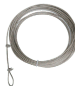
20m. de cable acero inox. de 4mm 2