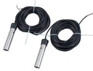
Dos sensores de nivel