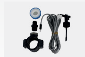
Kit de sensor de débito