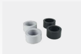
Kit de reductores a colar