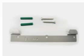
Kit de fixação de parede