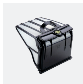
Filtro de grande capacidade (5 L) fácil de limpar