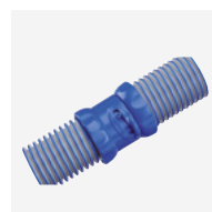
Mangueiras Twist Lock