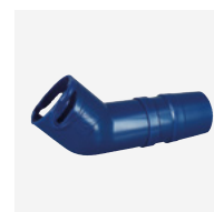
Cotovelo conector 45°