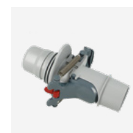
Válvula de regulação automática do caudal (skimmer)