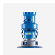
Medidor de caudal (aspirador)