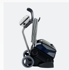
Carro de transporte