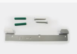
Kit fixation murale