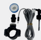
Kit détecteur de débit